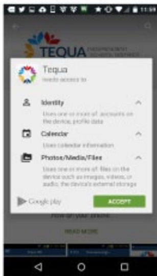
Lo que pide nuestra aplicación: